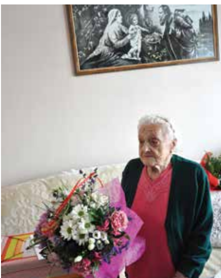
Szczęśliwa Jubilatka nie kryła wzruszenia

jedna z pierwszych w okolicy zaszczepiła się dwoma dawkami szczepionki na COVID – 19.