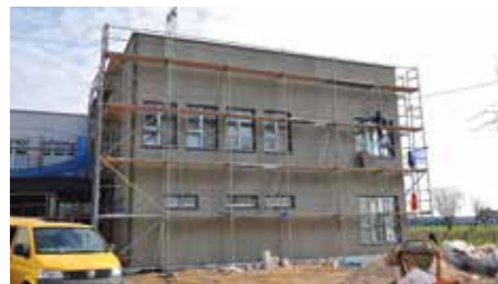
Budynek przy Szkole Podstawowej w Łęgu Przedmiejskim, w którym znajdzie się Przedszkole Samorządowe już teraz robi imponujące wrażenie