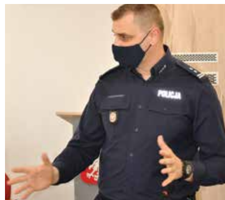
Komendant Miejski Policji mł. insp. prezentuje efekty pracy policji