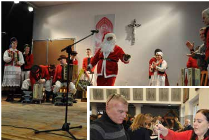
Gość z dalekiej Laponii ucieszył zwłaszcza dzieci