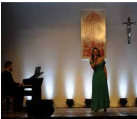
Artyści ożywiają głosy bohaterów bajek Disneya.