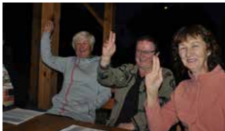
W Aleksandrowie głosowano „za” sprawozdaniem sołtysa