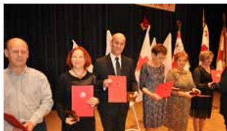
Wójt prezentuje dyplom honorowej nagrody 100-lecia PCK