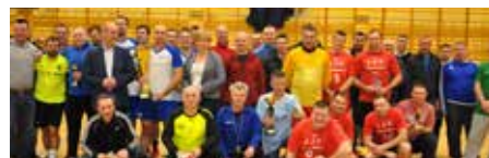
Ci, którym się chce tryskali humorem