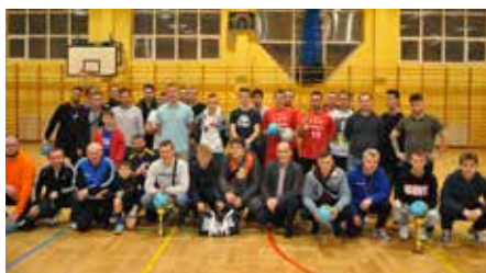
Liczna rzesza miłośników halówki