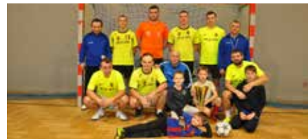
Zwycięska drużyna z Łęgu Przedmiejskiego