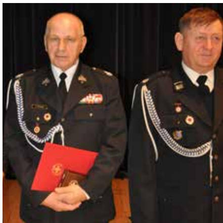
Przedstawiciele Klubu HDK z nagrodą 100-lecia PCK