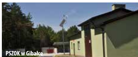
PSZOK w Gibalce

w Warszawie. Wartość projektu – 19 021,80 zł. z tego wartość dofinansowania wynosi – 9 320,68 zł