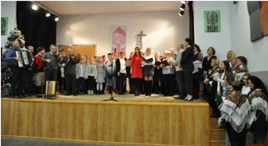
Do pierwszej kolędy stanęli wszyscy