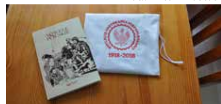
Przesyłka z Kancelarii Prezydenta RP na pamiątkę Narodowego Czytania