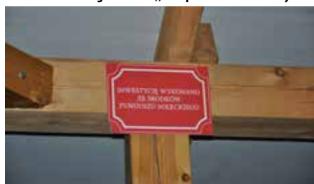
Tym bardziej, że nad głową głosujących był taki napis.