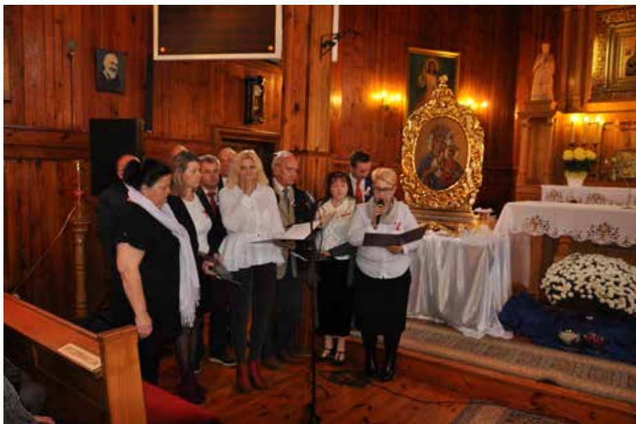
Występ w kościelnym koncercie dla Niepodległej