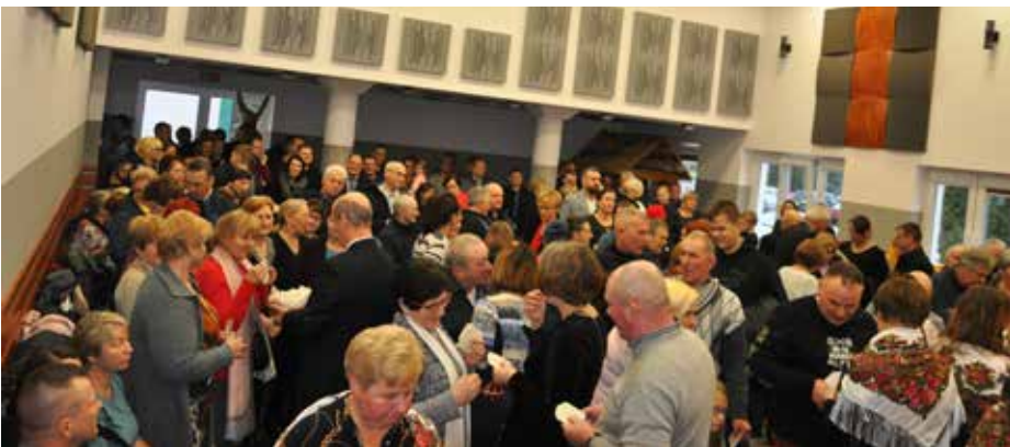
I zaczęło się dzielenie opłatkiem, serdeczne życzenia, uściski

Z powodu deszczowej pogody w niedzielę 22. grudnia, gminne spotkanie opłatkowe przeniesiono do sali widowiskowej CK-BiS. Skorzystały z tego zespoły, które śpiewem kolęd i pastorałek uświetniały wspólny, radosny wieczór, ale skorzystały także panie z kół KGW z Gnatów, z Nasiadek i Olszewki oraz z Łęgu Przedmiejskiego, które zaprezentowały na stoiskach pod dachem swoje rękodzieła. W ogóle wigilia stała się doskonałą okazją do spotkania się coraz aktywniejszych i bardziej pomysłowych kół naszych par, co może stać się nową tradycją tej gminnej uroczystości.