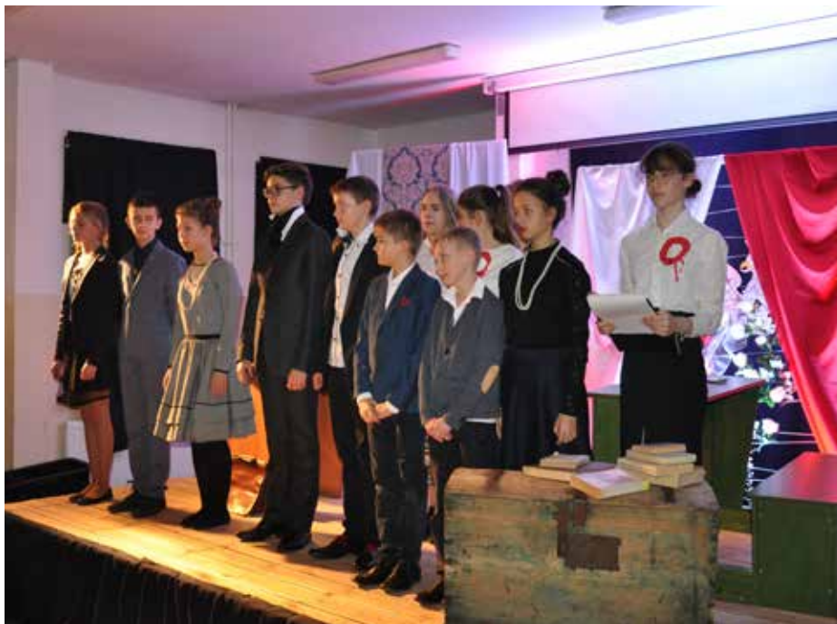
Młodzi artyści zasłużyli na rzęsiste brawa