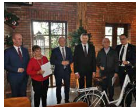
Nagrodzonym paniom z Olszewki kibicował wójt Lelisa