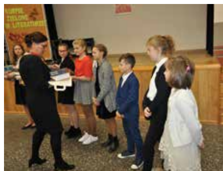
Nasi reprezentanci na konkursie finałowym