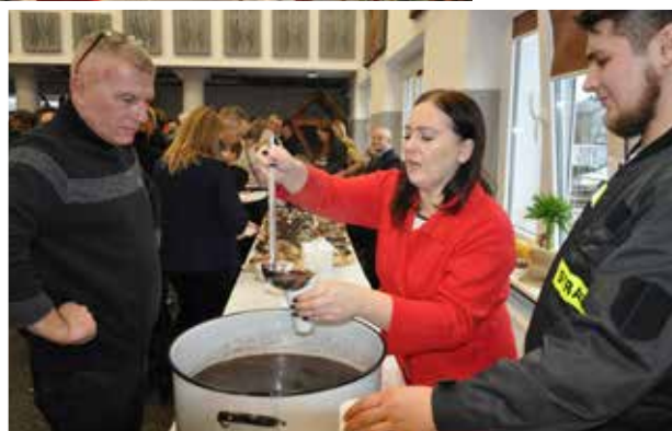
Strażacki barszcz rozgrzał każdego