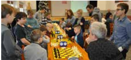
Pojedynki najmłodszych szachistów wzbudzały duże emocje

W IX dorocznym otwartym turnieju szachowym „O złotą wieżę” startowało łącznie 43. zawodniczek i zawodników, w tym 23. w turnieju A – kat. dzieci i młodzieży oraz 20. zawodników w turnieju B w kat. Open. Startowali zawodnicy z Łomży, Ostrołęki, Dżbenina, Rzekunia, Kadzidla, Ostrowi Mazowieckiej, Makowa Mazowieckiego, Łysych, Korczaków oraz z miejscowości gminy Lelis: Olszewki, Dąbrówki, Łęgu Starościńskiego i Lelisa. Organizatorami turnieju byli: Centrum Kultury - Biblioteki i Sportu w Lelisie, Wójt Gminy Lelis, Gminne Zrzeszenie Ludowe Zespoły Sportowe w Lelisie oraz Mazowieckie Zrzeszenie Ludowe Zespoły Sportowe. Sędziował, jak