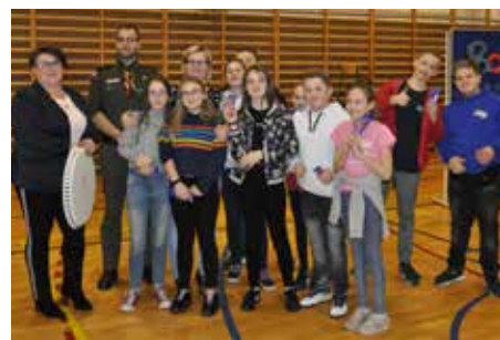
Wyróżnieni w harcerskiej grze terenowej