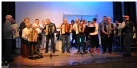
Zebrana ad hoc niezwykła kapela zagrała od ucha do ucha