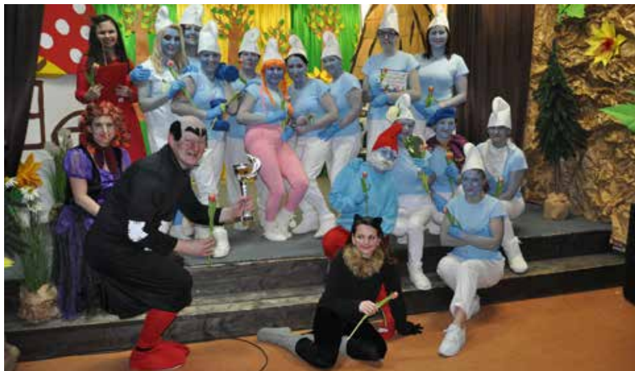
Gargamel i Smerfy po spektaklu byli bardzo szczęśliwi, że mogli rozbawić dzieci i ich gości