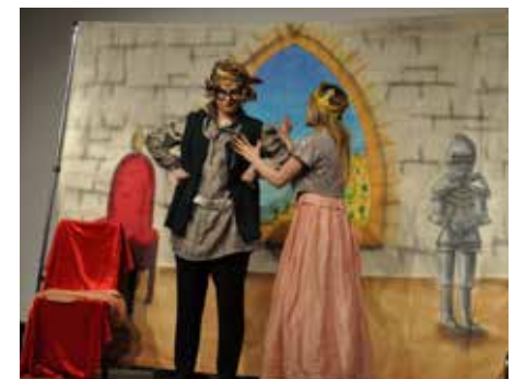
Bohaterowi bajki o wawelskim smoku