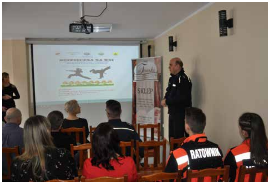
Prezentacja programu zajęć na szkoleniach i warsztatach