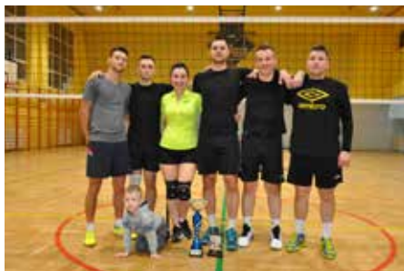
Zwycięska drużyna Lelis Legends