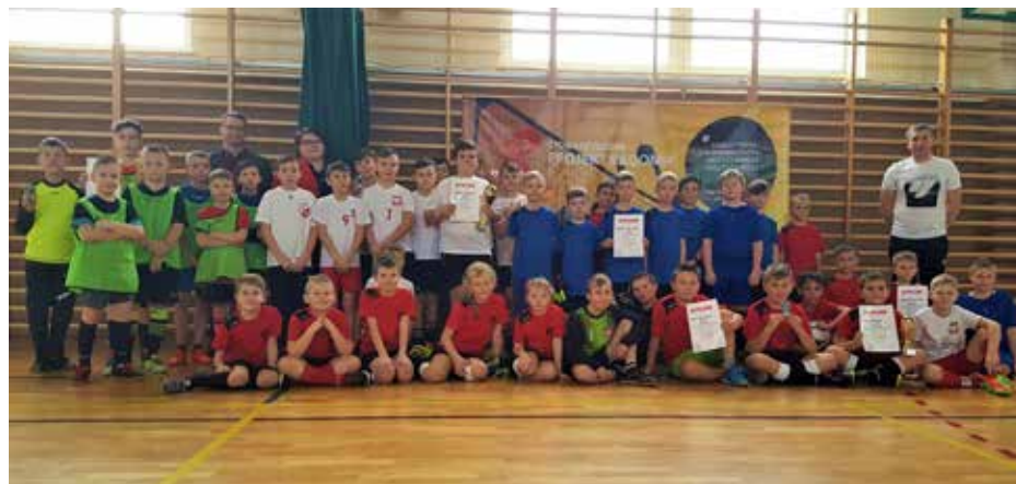
Dzieciaki dumnie pozują do wspólnej fotki