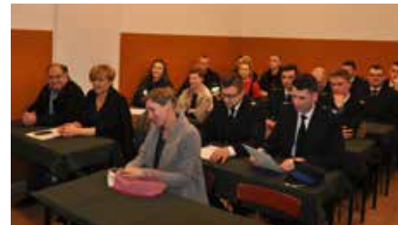
Strażacy ze swoimi dobrymi przyjaciółmi