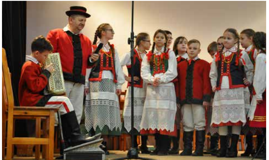
Emocji nie brakowało ani na scenie, ani na widowni

Kategoria do 16 lat – II miejsce – Grupa kołędnicza z Czarni za widowisko „Chodzenie z krzyżem”; III miejsce – Grupa dialektowa ze Szkoły Podstawowej w Chudku za widowisko „Ocalić od zapomnienia”. Wyróżnienia: Nowe Łatko z Lelisa (grupa młodsza) za widowisko „Dziecięce jercowanie dzieci przy niedzieli”; Nowe Łatko z Lelisa (grupa starsza) za widowisko „Dawne strachy i zamysły młodszej młodzieży”; Łysioziańskie nuty z Łysych za widowisko „Kiszenie Kapusty”; Burśtynki i Klonowskie