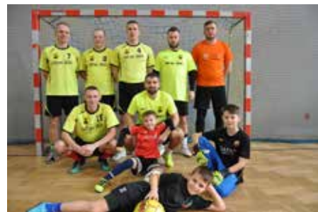
Drużyna LZS Łęg Przedmiejski umie cieszyć się z dobrej gry