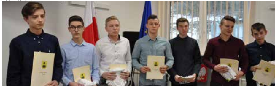
Nasi mistrzowie z rokowaniami na sukcesy ponadgminne