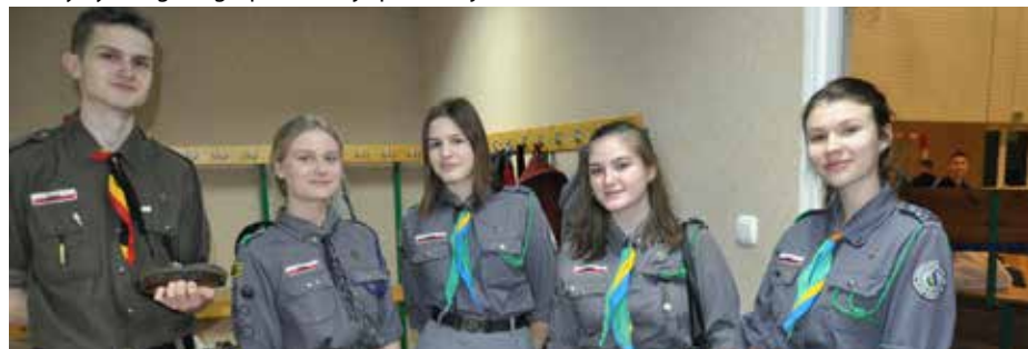
Na harcerzy zawsze można liczyć