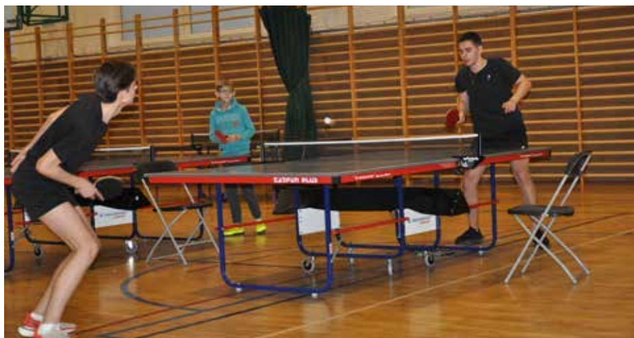
Walczone o każdą piłkę, o każdy punkt