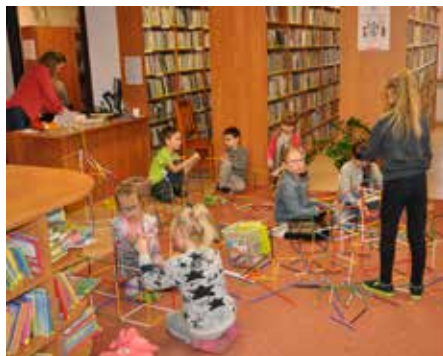
Biblioteka jest dobrym miejscem do zabawy, ale i czytania