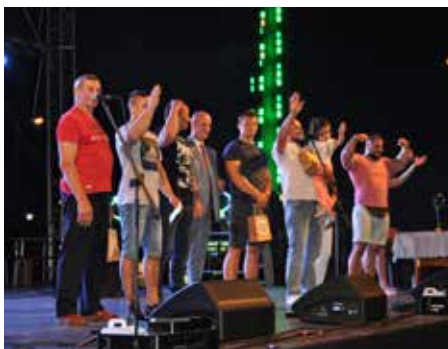
Najmocniejsi pozdrawiają zebraną publiczność