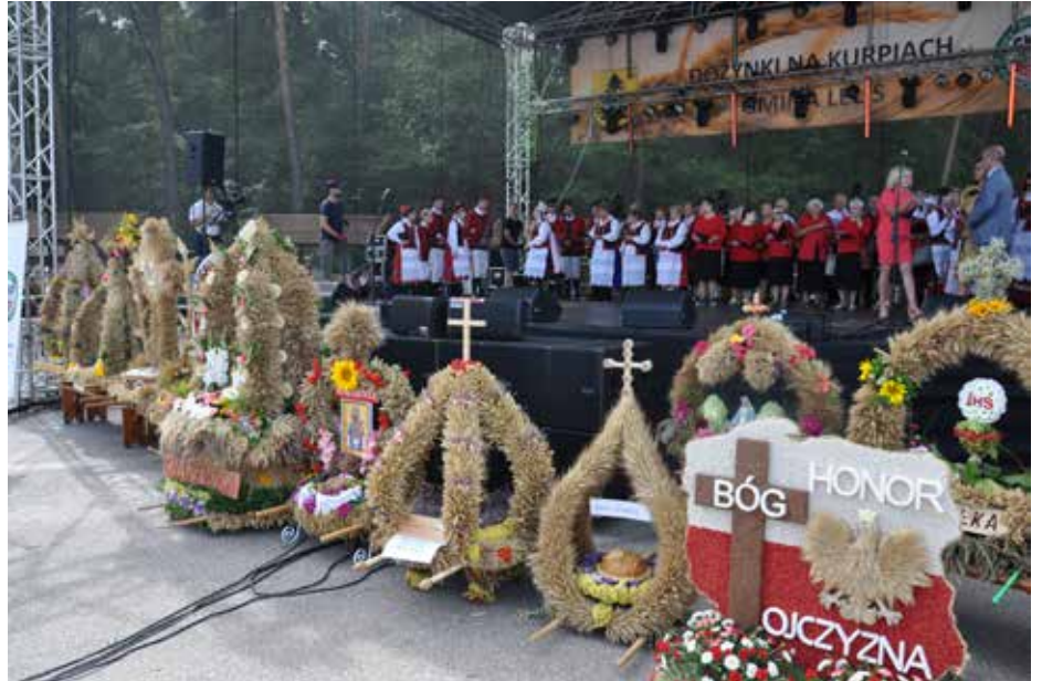
Można się cieszyć po trudnych żniwach