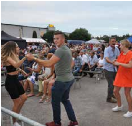
Dla każdego znalazło się miejsce do dobrej zabawy

Tekst i fot. Antoni Kustusz Więcej zdjęć: www.lelis.pl