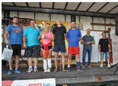
Zwycięzców z Napalmu Kadzidło rozpieszcza dumą