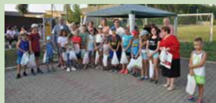
Dzieciaki były bardzo zadowolone ze swoich nagród