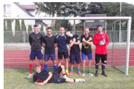
Zwycięzcy turnieju z Grabówką