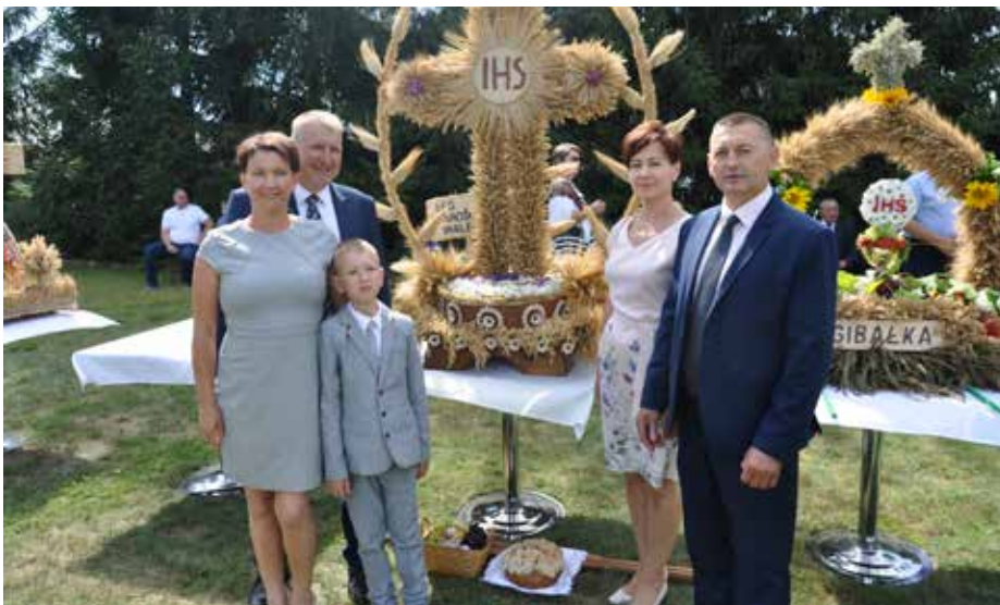
Zwycięski wieniec sołectwa w Łęgu Starościńskim-Walery