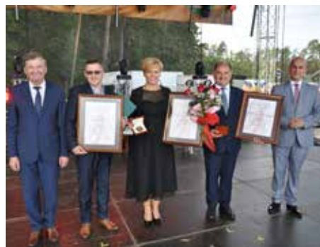
Nagrodzeni laurem marszałka mazowieckiego