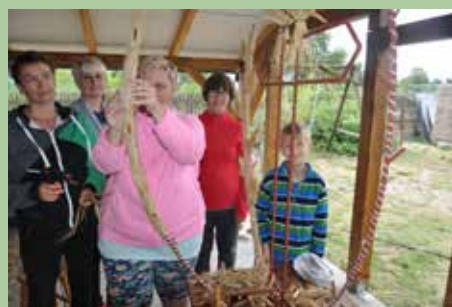
Wieniec zaczyna obrastać w kłosa