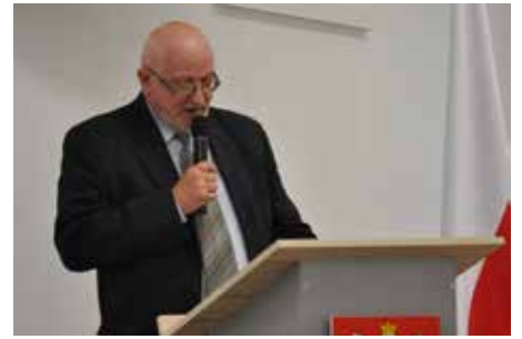
Redaktor na mównicy

W latach okupacji w naszej gminie w 10. egzekucjach zginęło 15. Polaków, a ogólna liczba pomordo-