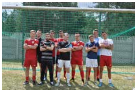
Priviet Lelis tym razem najlepszy