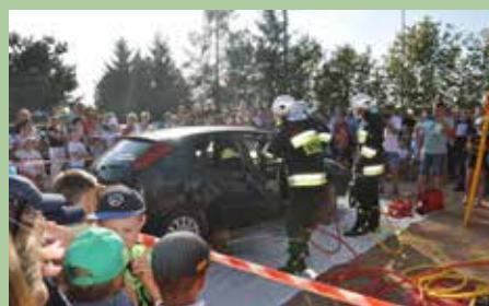
Strażacy cięli bezlitośnie

dła Klubu Strzelectwa Sportowego „Obrońca” z Troszyna, który przygotował strzelnicę z broni pneumatycznej i promował strzelectwo sportowe jako formę spędzania wolnego czasu oraz bezpiecznej rywalizacji w gronie rówieśników.