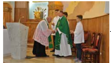
Z ogromnym szacunkiem pożegnał proboszcza ks. dziekan