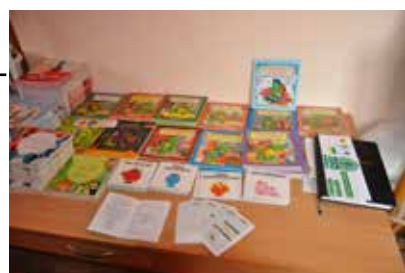
Oferta dla małych czytelników