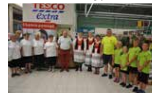
Wyróżnione reprezentacje w Tesco

W tym roku triumfowały panie z Koła Gospodyń Wiejskich Chudkozionki z Chudka (gm. Kadzidło – 5 tys. zł). Nagrody otrzymały także: Dzienny Dom Senior+ w Durlasach (3 tys. zł) oraz Stowarzyszenie Projekt Radomir z Obierwi (1 tys. zł). Najwięcej głosów (3874) otrzymał projekt „Kultywowanie i utrzymanie tradycji regionu kurpiowskiego poprzez warsztaty organizowane dla dzieci i młodzieży z regionu, jak poza regionu” zgłoszony przez KGW Chudkozionki. Drugie miejsce (3707 głosów) zajął projekt „Nie jestem i nie będę sam – Budowa paleniska oraz grilla wykorzystywanego przez społeczność Durlas oraz mieszkańców gminy Lelis” zaproponowany przez Dzienny Dom Senior+ w Durlasach. Projekt obejmuje budowę paleniska oraz podwieszanego grilla, tak, aby można było organizować spotkania dla większej grupy osób przy pełnym zabezpieczeniu przeciwpożarowym. Trzecia lokata należy do Projektu Radomir z Obierwi (2309 głosów). Propozycja stowarzyszenia to „Aktywne Wakacje 2019” – poprzez organizację wakacyjnych zajęć Radomir chce zwracać uwagę dzieci i młodzieży na różnorodność zabaw ruchowych i dyscyplin sportowych dostępnych w naszym regionie. (ak)