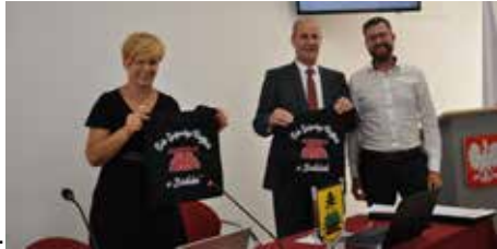
Torba KGW wywołała spore zainteresowanie

Rada przychyliła się do wniosku Komisji Skarg i Petycji i jednogłośnie oddaliła skargę na działalność Wójta Gminy.