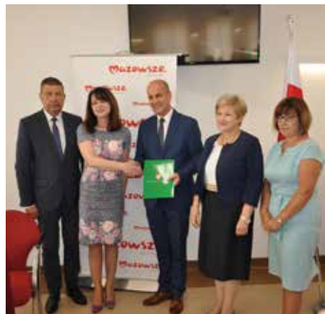
Wójt i skarbnik gminy po podpisaniu umów