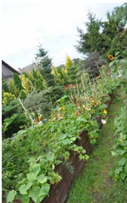
Podwyższona rabata pana Henryka zawsze pełna plonów