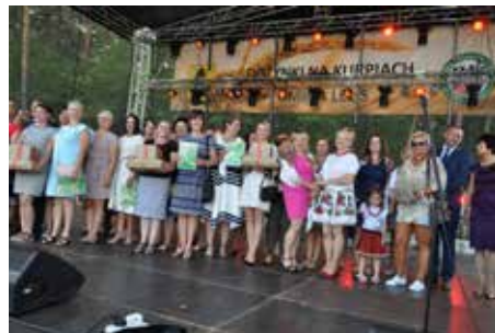
Laureaci konkursu kulinarnego „Smaki regionu”