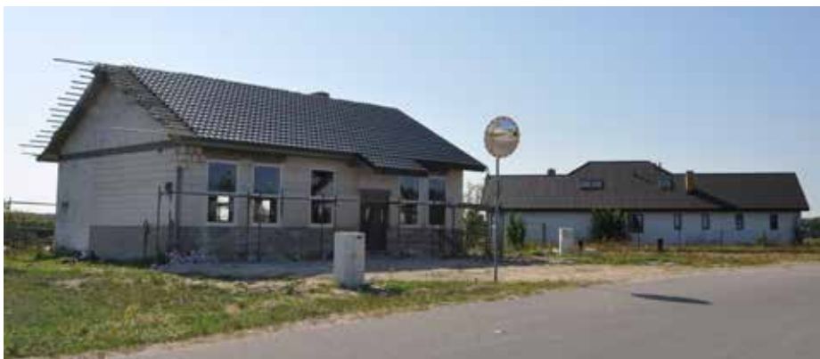
Świetlica w Nasiadkach w końcu sierpnia, już z wstawionymi oknami