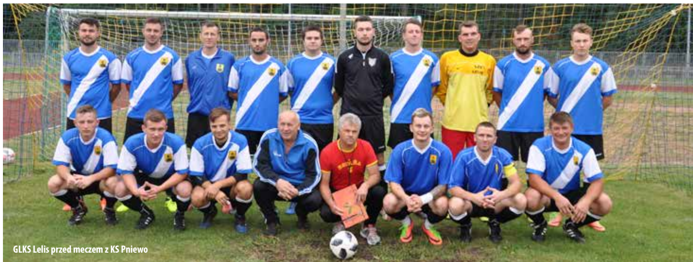
GLKS Lelis przed meczem z KS Pniewo

W sezonie 2019/2020 w rozgrywkach piłkarskiej B klasy w grupie Ostrołęka wystąpi 10 drużyn, w tym 5 z powiatu ostrołęckiego. Są to: GLKS Lelis, Kurpik Kadzidło, Orz Goworowo, Świt Baranowo i ULKS Ołdaki.