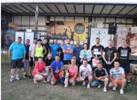
Wszyscy zgodnie pozują do wspólnego zdjęcia