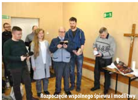
Rozpoczęcie wspólnego śpiewu i modlitwy