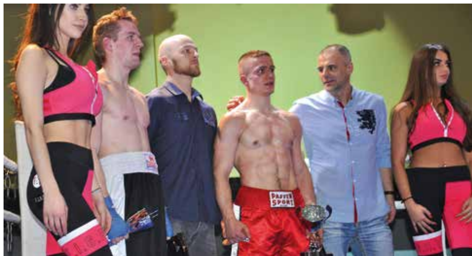
Słodki smak pożegnalnego zwycięstwa