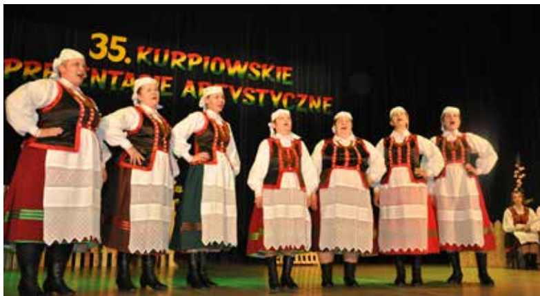
Krzaki i Pniaki z Łęgu Przedmiejskiego