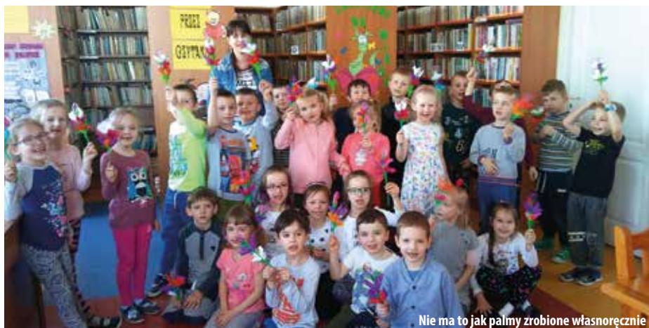
Nie ma to jak palmy zrobione własnoręcznie