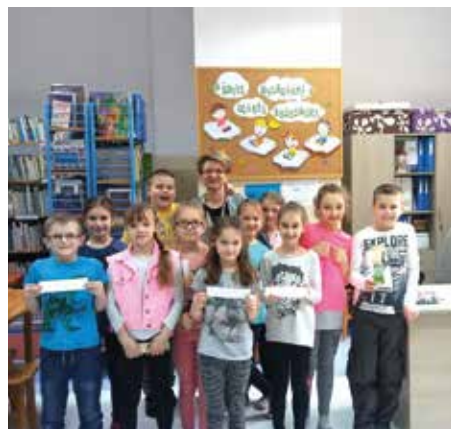
My już wiemy jak wyrażać prawdę