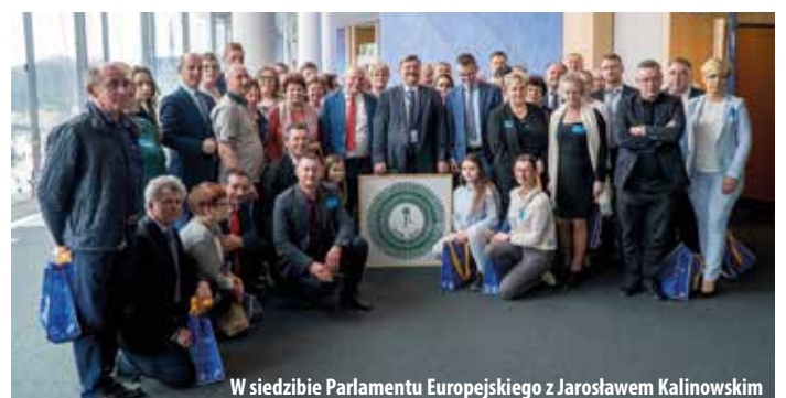
W siedzibie Parlamentu Europejskiego z Jarosławem Kalinowskim