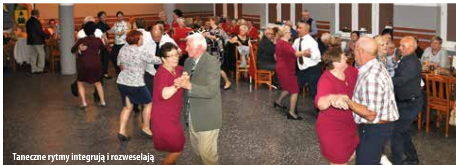
Taneczne rytmy integrują i rozweselają