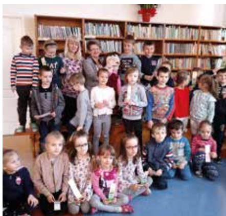
Zimowe wierszowanie w Łęgu Przedmiejskim