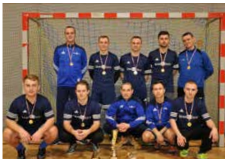
Zwycięzcy z Uniglass Łomża

Ostatecznie, klasyfikacja drużyn, które stanęły na starcie, ukształtowała się następująco: 1. Uniglass