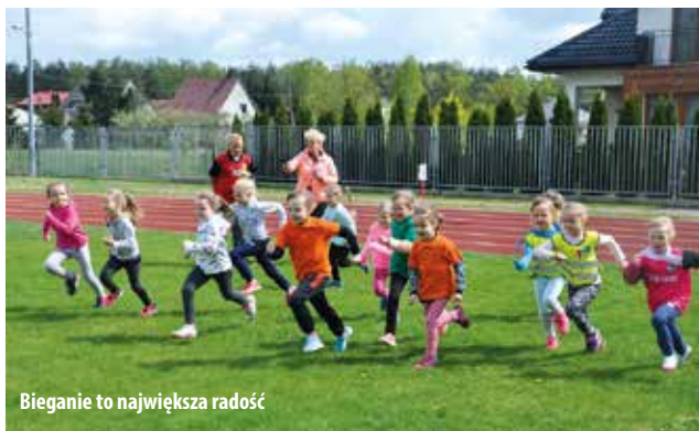
Bieganie to największa radość