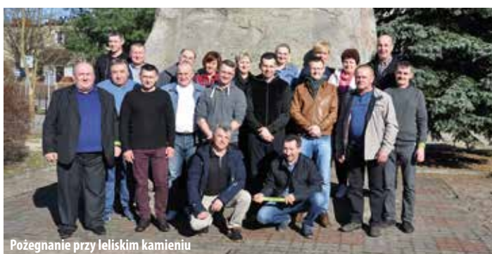
Pożegnanie przy leliskim kamieniu