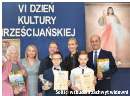
Solisci wzbudził zachwyt widzów