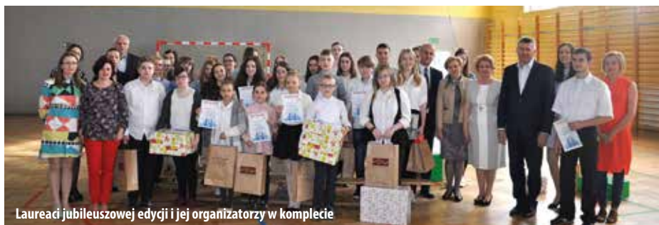
Laureaci jubileuszowej edycji i jej organizatorzy w komplecie