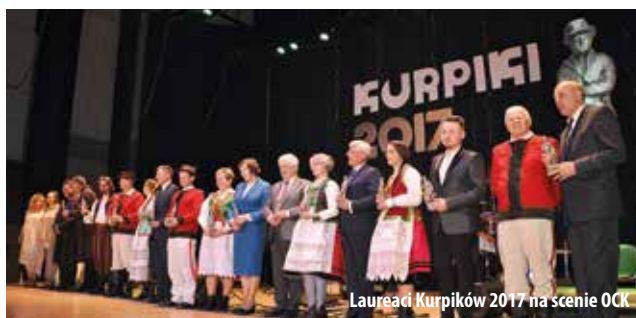
Laureaci Kurpików 2017 na scenie OK