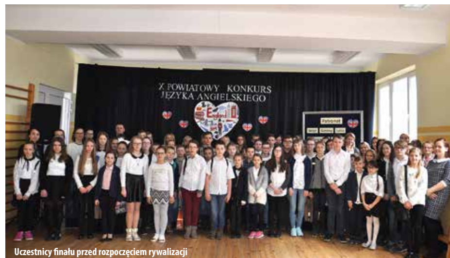
Uczestnicy finału przed rozpoczęciem rywalizacji