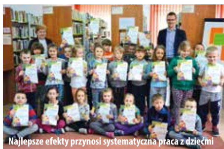
Najlepsze efekty przynosi systematyczna praca z dziećmi

Również pod kątem wypożyczeń biblioteki z terenu gminy Lelis okazały się bezkonkurencyjne i ulokowały się na pierwszej pozycji z wynikiem 329,40 wypożyczeń na 100 mieszkańców ogółem, a więc zarówno do domu, jak i na miejscu w czytelni,