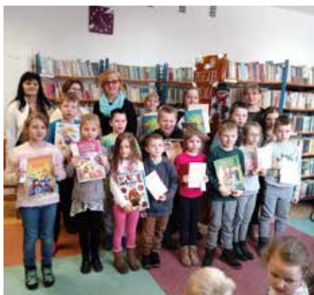
Młodzi adepci poezji z Łęgu Starościńskiego