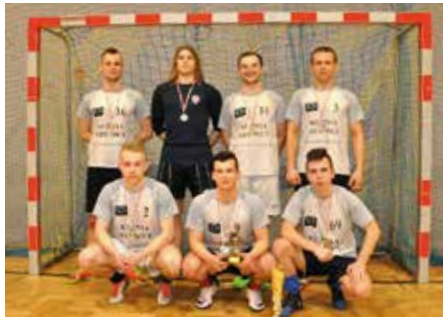
Srebrne medale dla Art.-Met Olszewka