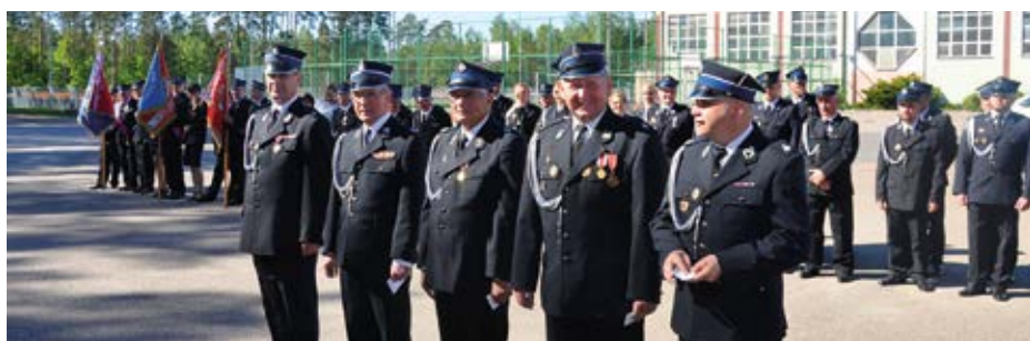
Zasłużeni działacze ZOSP RP z odznakami za wysługę lat