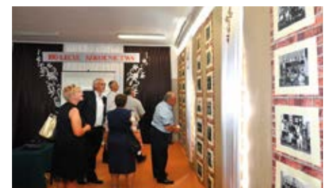
Wspomnienia odżywają przy wystawie pamiątkowych zdjęć z szkolnych kronik