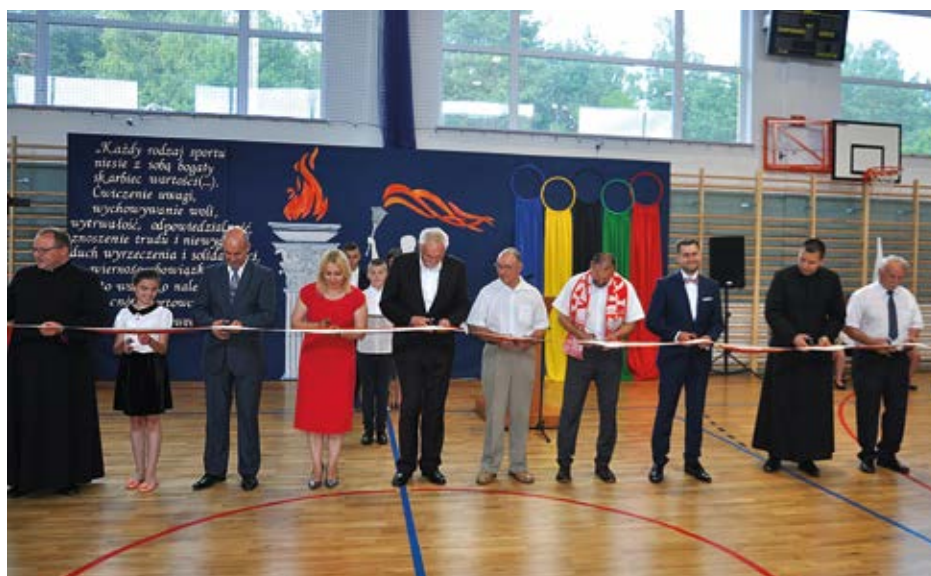
Zgodne przecięcie wstęgi dobrze wroży nowej sali