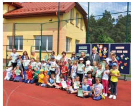
Jak widać humory dopisywały wszystkim małym olimpijczykom i ich opiekunom