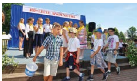
Przystępujemy do budowania swojej szkoły