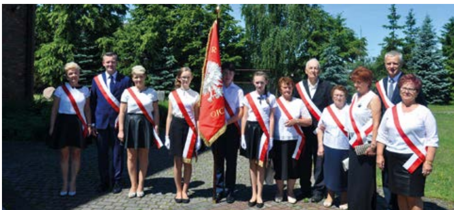
Wielopokoleniowy poczet sztabarowy szkolnej społeczności przed uroczystą Mszą św. w kościele parafialnym w Łęgu Starościńskim