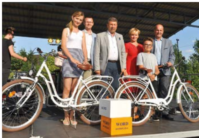
Podwójne losowanie rowerów, specjalnie dla Łęgu Przedmiejskiego