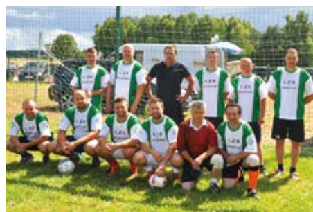
Takiej drużynie Żonatych nikt nie pokona