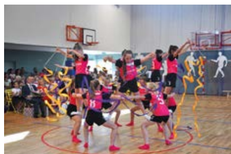
Stylna piramida tym razem pod dachem