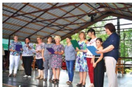
„Lato, lato, lato czeka” z całego serca śpiewają członkinie Kołka Rolniczego „Zagajnica”