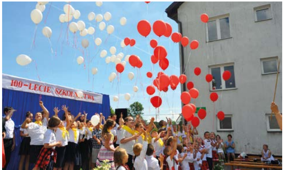
Białe i czerwone baloniki wleciały na znak radości z niepodległości