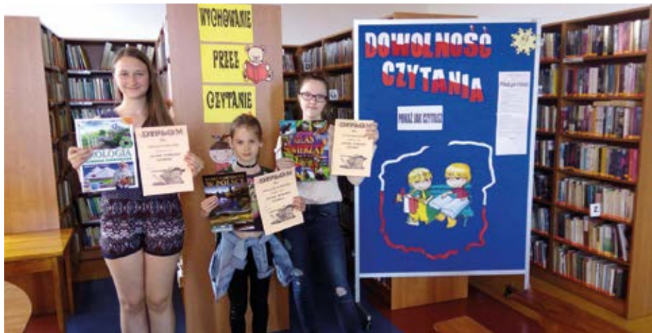
Natalia Staśkiewicz

Wszyscy uczniowie otrzymali dyplomy oraz upominki książkowe ufundowane przez CK-BiS w Lelisie. Podczas spotkania mieliśmy zaszczyt gościć dyrektorów szkół, którzy życzyli nowym użytkownikom biblioteki wielu ciekawych lektur i niezapomnianych wrażeń w obcowaniu z literaturą.