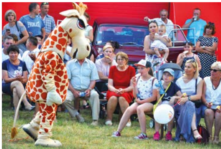
Sympatyczna maskotka rozbawiała festynowiczów