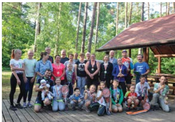
Uczestnicy rodzinnego rajdu rowerowego z organizatorami po wręczeniu nagród