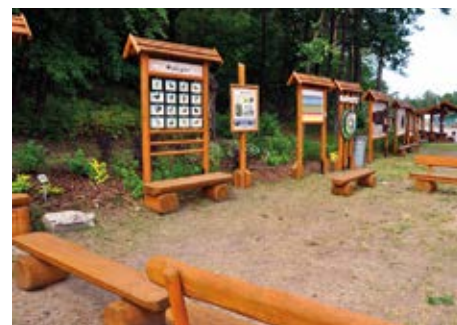
Ścieżka ekologiczna w centrum Lelisa, uczy, bawi, zaciekawia.

Sporządził: Stefan Prusik, Wójt Gminy Lelis