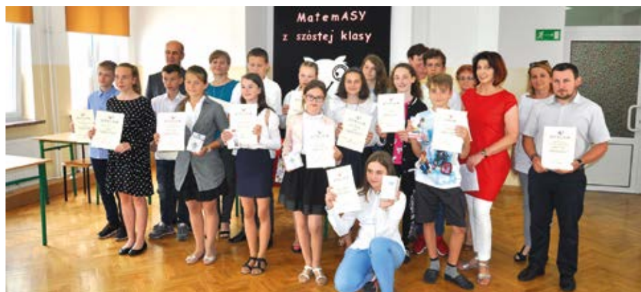
Matematyczne talenty po wręczeniu nagród i dyplomów potwierdzających ich matematyczne kompetencje