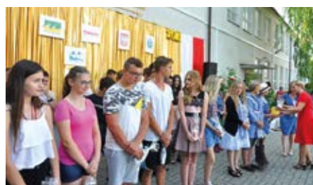
Wyróżnienie najaktywniejszych uczestników projektów edukacyjnych

Przyszkolny festyn stał się przede wszystkim okazją do zaprezentowania dorobku i nagrodzenia uczestników szkolnych projektów edukacyjnych. Szczególne wrażenia rozbiły dokonania gimnastyków i sportowców, którzy pokazywali nową konkurencję sportu czyli speed-ball, wspaniały Szkolny Ogród Zmysłów z nowymi formami prezentacji uprawy ziół i kwiatów, fantastyczne i niezwykle rzeźby ogrodowe, instrumenty muzyczne, a nawet