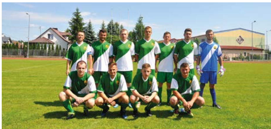
Piłkarze GLKS Lelis w meczu z Narwią na własnym stadionie