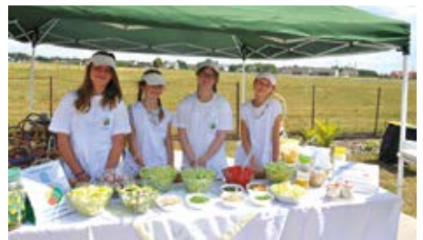
Członkinie szkolnego sklepiku dbają o zdrowe wyżywienie