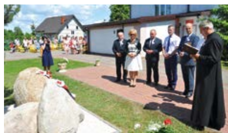
Przed poświęceniem kamieni z tablicami pamiątkowymi