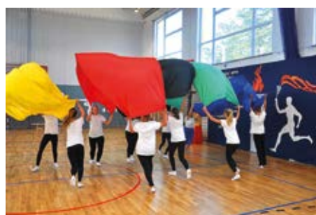
Szkolnej społeczności nigdy nie brakowało widowiskowych pomysłów